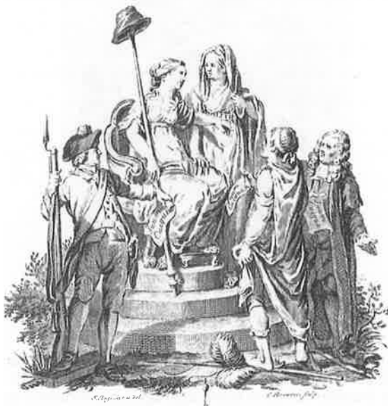
Te UTRECHT, bij GISBERT TIMON VAN PADDENBURG, EN ZOON. MDCCLXXXVI.

op los leven, terwijl getrouwde mannen met de zorg voor vrouw en kinderen veel belang hebben bij rust en veiligheid. Zolang hun bezittingen met rust werden gelaten en zij als zelfstandig gezin in vrijheid konden leven, zouden de burgerlijke gezinnen tevreden zijn.