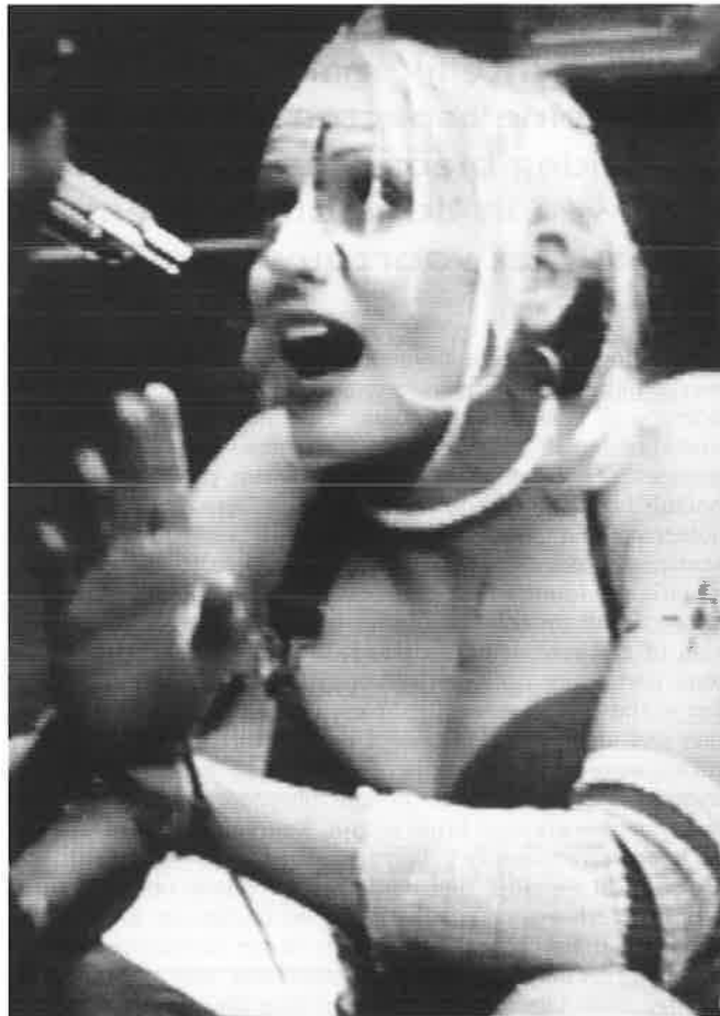
Tank Girl geeft te kennen dat ze een microscoop en een pincet nodig heeft. (Bron: collectie auteur).

Qua toekomstbeeld vormen de jaren-tachtigproducties als Alien en Blade Runner het spiegelbeeld van sixties films als Barbarella : duister en somber tegenover kleurrijk en optimistisch. Kleur en humor kwamen opnieuw in beeld toen in 1995 Tank Girl verscheen, evenals Barbarella gebaseerd op een underground stripverhaal. Alhoewel deze film ogenblikkelijk in de eregalerij van het cultcircuit werd opgenomen, ging dit niet gepaard met navenante bezoekersaantallen. Het vermoeden dringt zich op dat deze overigens dolkomische, flitsend vormgegeven en razendsnel gemonteerde actiefilm nèt iets te vrouwvriendelijk was voor het nog steeds overwegend mannelijke publiek. Regisseuse Rachel Talalay en scenarioschrijfster Tedi Serafian vestigden een nieuw baanrecord voor seksistische grappen over mannen. Deze werden in moordend tempo gedebiteerd door hoofdrolspeelster Lori Petty, een gouden keus ondanks dat niemand minder dan Madonna eveneens geïnteresseerd schijnt te zijn geweest.