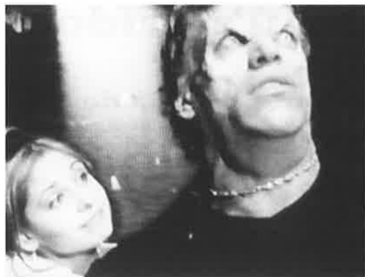
Met een sarcastische glimlach helpt Buffy een vampier naar de andere wereld.

Het is dan ook opmerkelijk dat de makers toestemming kregen voor een tweede poging, ditmaal als televisieserie. Ongebruikelijker nog is dat deze herkansing al snel een daverend succes werd. Voor een groot deel is dit te danken aan de nieuwe hoofdrolspeelster Sarah Michelle Gellar. Waar Buffy Swanson als het ware bij toverslag van een verwend mormel tot de moeder Theresa van de vampierbestrijding transformeert, maakt Buffy Gellar van aflevering tot aflevering een ontwikkeling door waarbij ze, hoe vergezocht de scenario's soms ook zijn, zelden haar geloofwaardigheid verliest. Ze is ongewoon sterk en taai - vampiers zijn niet de gemakkelijkste tegenstanders -, maar niet onoverwinnelijk, en zich terdege hiervan bewust. Ze is altijd moedig, maar slechts bij vlaggen opofferingsgezind. Ze is geen briljante studente, maar op een praktische manier intelligent, zoals blijkt uit de vlijm-