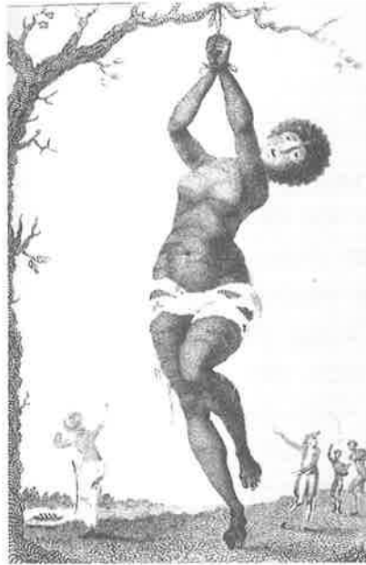
Flagellation of a female Samboe slave.

vulling op het werkhuisdietf. Zulke beschrijvingen moesten aantonen dat het werkhuispersoneel er niet in was geslaagd hun autonomie en dus hun menselijkheid uit te schakelen. De letterlijke weergave van hetgeen ze tegen een opzichter hadden gezegd diende een soortgelijk doel. De vrouwen lieten ermee zien dat hun stem, dat wil zeggen hun subjectiviteit, niet geheel tot zwijgen was gebracht.