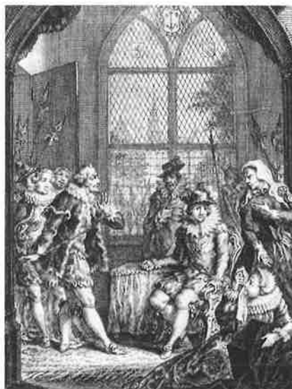
Gravure uit 'De Beleegering van Haerlem' (1770) van J.C. de Lannoy, vijfde bedrijf/veertiende scène.

De Lannoy gaat in De Beleegering van Haerlem niet aan de hongersnood voorbij,