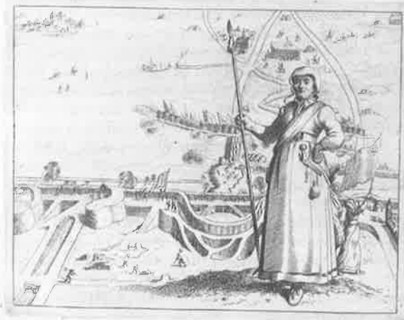
Ghedrukt tot Haerlem, by Kornelis Theunisz. Kas , op de Marckt, in de Nieuwe Druckery, Anno 1660.

Ghespeelt tot Haerlem, op den 29 Junij, Anno 1660.