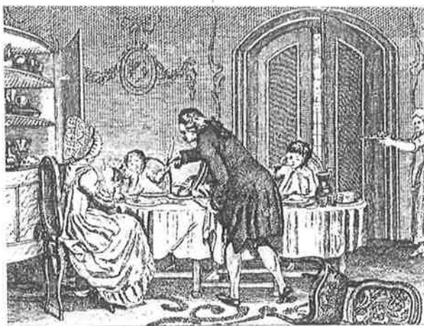
Vader heeft u lief myn kind: 'tis uw beste Vriend, Denk, als hy iets weig'ren moet, dat het u niet dient.

opiniebladen hadden een nadrukkelijk politieke boodschap en inhoud. Met name de patriotten, die ideologisch nauw verwant waren aan de Franse revolutionairen van die tijd, deden van zich horen op de politieke tijdschriftenmarkt. Naast de moralistische boodschap van goed en braaf burgerschap als reddingsmiddel voor de Republiek, klonk nu steeds luider de patriotse roep om moedig en ijverig Bataafs burgerschap. Een groot verschil tussen enerzijds de moralistische spectators en anderzijds het genre van de politieke opiniebladen was dat de schrijvers in de spectators geen politiek getinte uitspraken wensten te doen en zich uitsluitend richtten op de juiste zeden en moraal van de achttiende-eeuwse burger, terwijl de journalisten die de opiniebladen volschreven, geen blad voor de mond namen en duidelijk politiek partij kozen. Zo bezien leken beide tijdschriftgenres een heel ander doel na te streven en een verschillend publiek te bedienen. Maar wanneer gekeken wordt naar hetgeen zij schreven over goed burgerschap, blijkt dat dit verschil helemaal niet zo groot is: zowel in moralistische als in politieke vertogen werd benadrukt dat niet zozeer afkomst en rijkdom, als wel de juiste houding en goed gedrag factoren waren die iemand tot een goed burger maakte. In de spectatoriale geschriften werd goed burgerschap onder meer beschreven in artikelen over vaderlandsliefde, opvoeding en etiquette. In de politieke opiniebladen werd bur-